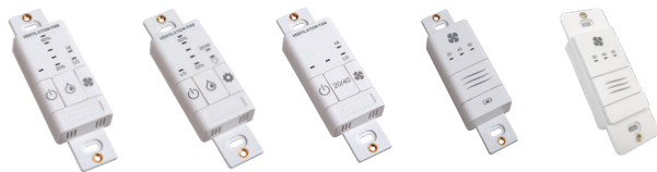
99-GBC02 99-GBC03 99-GBC04 99-DET02 99-DET01

99-RX02 - Répéteur sans fil Airflow Augmente la portée des minuteries sans fil 99-DET02. Se branche dans une prise de courant de 120 V. Connectivité sans fil entre la commande principale et à la minuterie 99-DET02. Installation à mi-chemin entre la minuterie et la commande principale au mur si la minuterie est hors de portée.